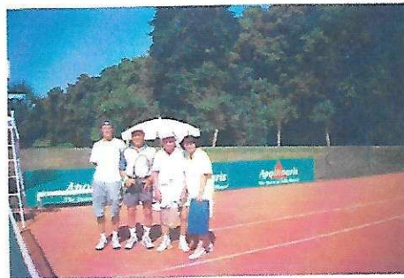
Deutscher Meister 2001