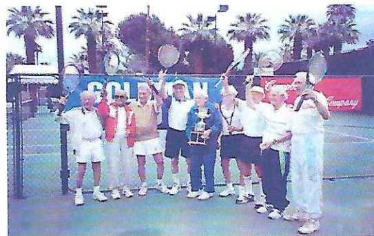
Goldman World Cup 2004 USA