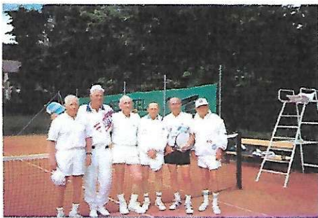
Länderwettkampf in Pörschach 1993