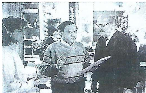
Wurde vom Vorsitzenden des SV Eintracht Osterburg mit der goldenen Ehrennadel des LSK Sachsen Anhalt ausgezeichnet:

Er sagte, mit einer gesunden Lebensführung und Lebensweise und der nötigen Portion Selbstbewusstsein kann man es im Tennissport weit bringen. Aber nicht nur im nationalen, auch im internationalen Wettbewerb war er erfolgreich.